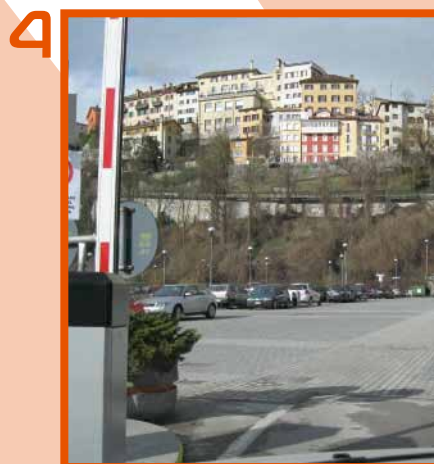
La sbarra si apre, si può entrare/uscire.