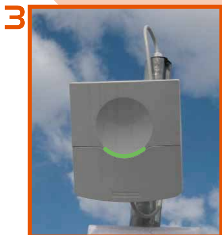
Il "sorriso verde" dell'antenna conferma l'avvenuto riconoscimento