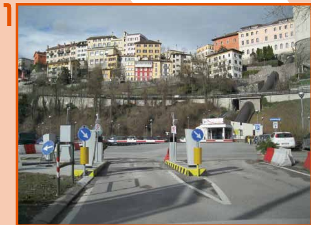
Avvicinarsi molto lentamente alla sbarra*