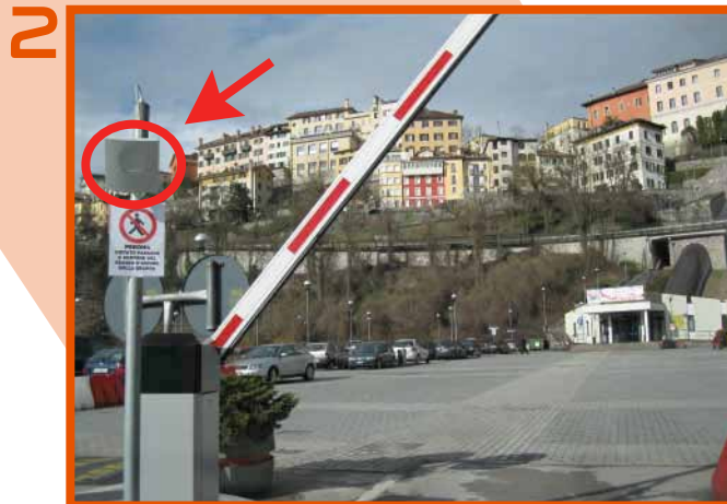
Attendere il riconoscimento del sistema (guardare l'antenna evidenziata nella figura con il circoletto rosso)