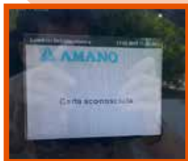
In caso di errore controllare il display per verificare il problema